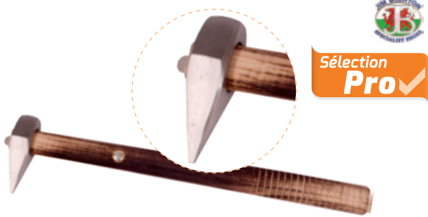
ÉTAMPE MANCHE BOIS JIM BLURTON