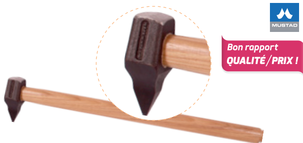
ÉTAMPE MANCHE BOIS MUSTAD

Étampe manche bois fabriquée à partir d'acier durci pour plus de durabilité et pour réduire au minimum le risque de fractionnement. Manche en bois pour une prise confortable.